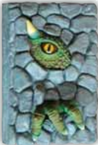
IL DIARIO SEGRETO DEI MOSTRI 60796479 € 14,90