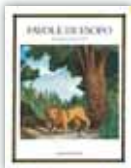
Favole di Esopo > Prezzo: € 13,90 > ISBN: 60792693