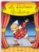
La filastrocca di Pinocchio > Prezzo: € 13,90 > ISBN: 60794079