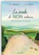
La strada che non andava in nessun posto > Prezzo: € 14,50 > ISBN: 60796349