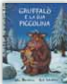
Gruffalò e la sua piccolina > Prezzo: € 12,50 > ISBN: 79276979