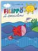
Filippo il pesciolino > Prezzo: € 12,90 > ISBN: 60796189