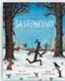
Bastoncino > Prezzo: € 12,90 > ISBN: 60792402