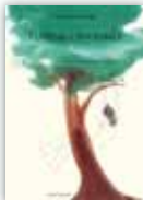
Tonino l'invisibile > Prezzo: € 13,50 > ISBN: 60794499