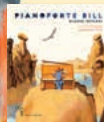
67149957 Pianoforte Bill