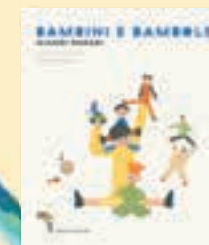
67149445 Bambini e bambole