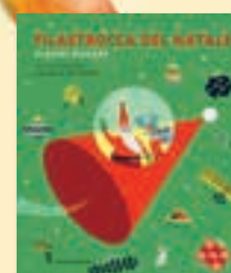
29600731 Filastrocca del Natale