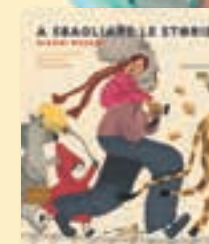
29600069 A sbagliare le storie